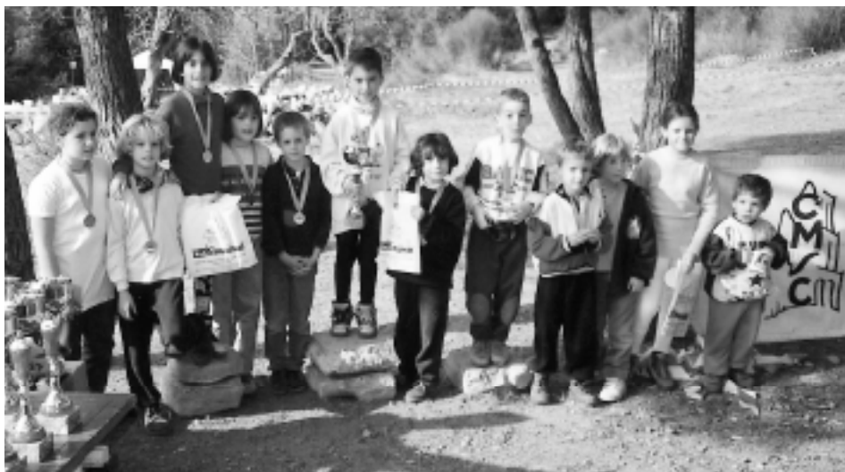
■ Els escolars catalans s'incorporen a l'orientació. Collserola, 1997.

Aquest curs però ja al 1998, gràcies a l'oportunitat brindada pel nou secretari general de l'Esport, Pere Sust, es pogué participar per primera vegada als Campionats d'Espanya Escolars celebrats a Múrcia, malgrat la limitació d'haver de competir per escoles i no entre campions escolars. L'IES de Tremp i l'IES Vidreres, malgrat l'escassa experiència, feren un digne paper i atesoraren experiència per a futures edicions.