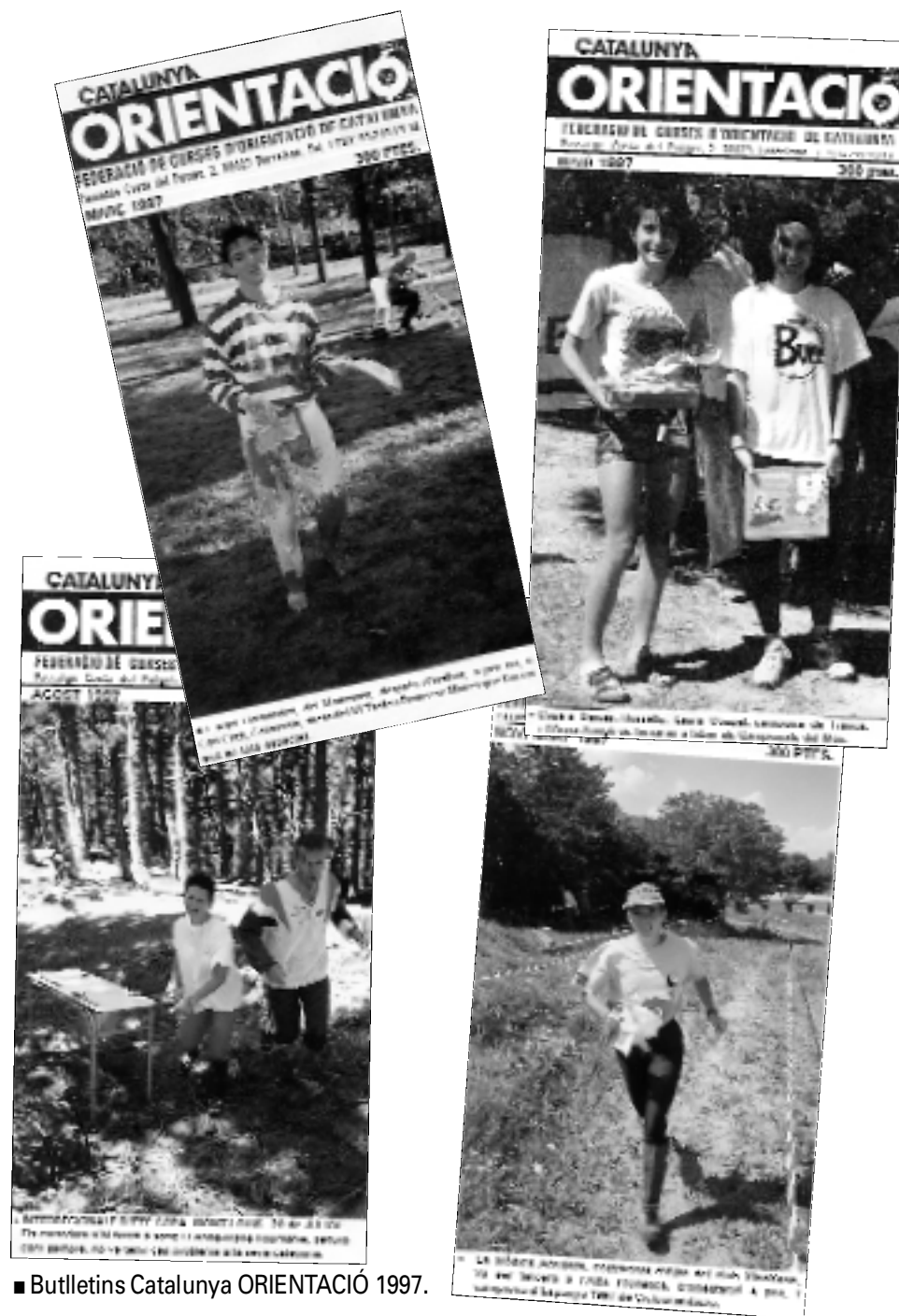
■ Butlletins Catalunya ORIENTACIÓ 1997.