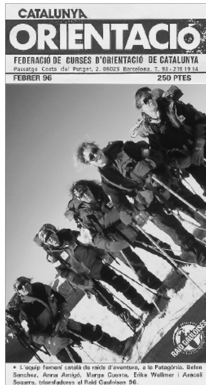
■ Butlletins Catalunya ORIENTACIÓ 1996.