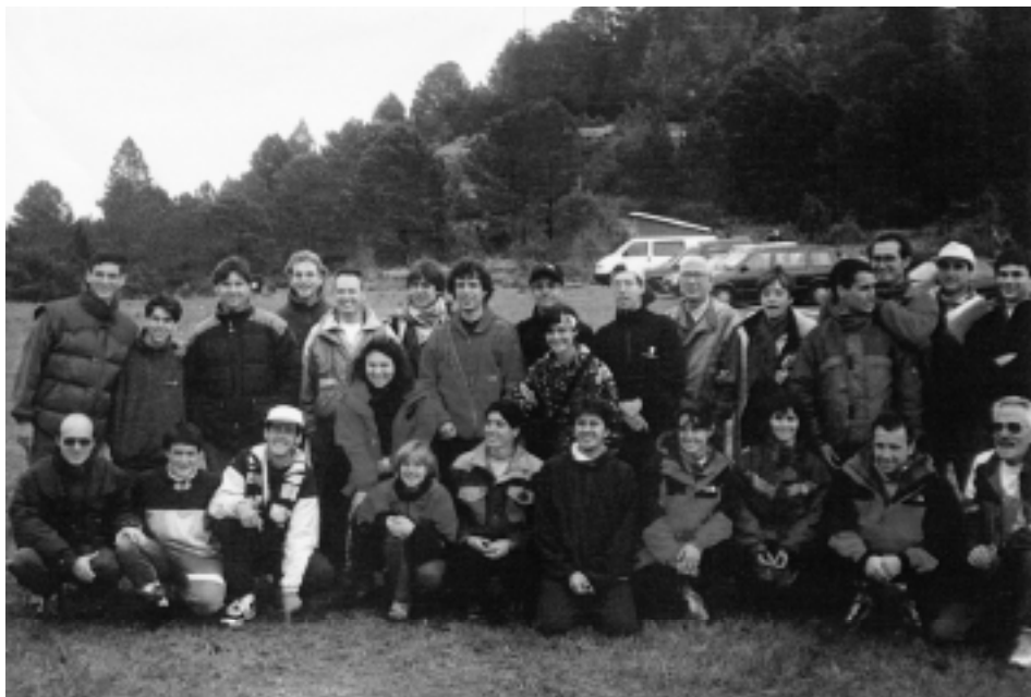
■ Organitzadors dels 2 Dies Internacionals, satisfets de la feina ben feta.

Al 96, el prestigi de la Federació durant vuit anys d'il·lusionada activitat queda palès amb la perfecta organització dels Dos Dies de Catalunya, prova valedora per a la Lliga Espanyola. Als boscos de Rojals, Conca de Barberà, malgrat es donaren cita solament cent cinquanta participants d'arreu de l'Estat i d'Europa, l'organització fou d'alt nivell: Un mapa d'un milió quatre-centes mil pessetes, el més car de tots els mapes catalans, bon tríptic de convocatòria, butlletí d'informació estil O-Ringen, traçats de circuits d'igual exigència tècnica que nivell d'interès, resultats instantanis de cordill i d'ordinador, satisfacció dels propietaris dels terrenys per col·laborar en un event notable i butlletí de resultats amb un bon reportatge gràfic mostraren la capacitat de resposta de l'orientació catalana a qualsevol repte d'organització. Les categories absolutes varen ser guanyades per la sueca, Anna Bôrges, i el corredor txec Marek Petrivalsky que poc després, i a partir del COC, es convertiria en el tècnic, entrenador i seleccionador de la FCOC, donant una bona empenta a l'orientació catalana amb la seva dedicació i vàlua.