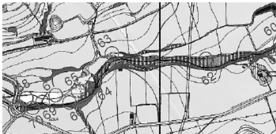
■ Fragment del circuit permanent Bosc de Ribera, Vic, i el control 52.

Mamífer molt menut, d'aproximadament 10 centímetres amb la cua inclosa, que és més petit que el ratolí casolà. [...] La musaranya nana és el mamífer més petit del món.